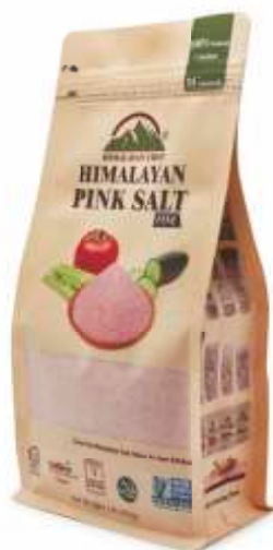
5309 (Sól drobnoziarnista) 5310 (Sól gruboziarnista)