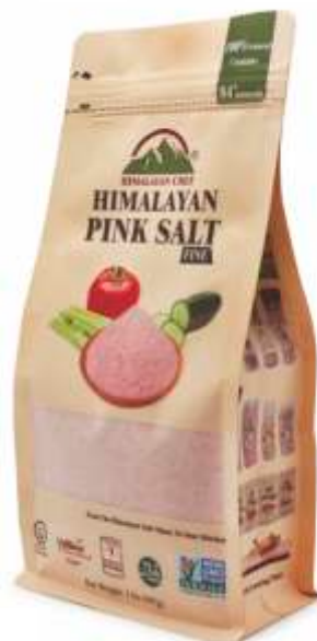
5527 (Sól drobnoziarnista) 5528 (Sól gruboziarnista)